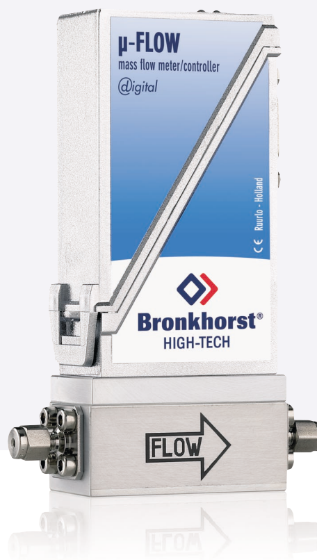
Массовый расходомер для жидкостей на сверхмалые расходы серии L01