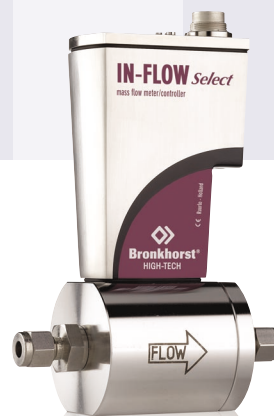
Расходомер серии IN-FLOW Select, модель F-112AI