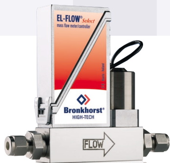
Регулятор расхода серии EL-FLOW Select, модель F-201CV