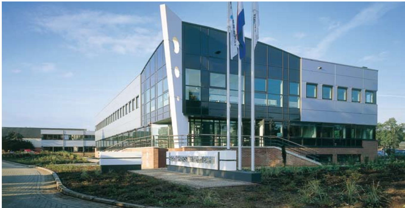
BRONKHORST HIGH-TECH HEADQUARTERS, THE NETHERLANDS